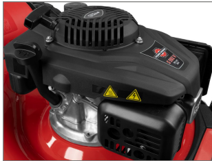
4 in 1 - Rasenmäher Seitenauswurf, Mähen, Mulchen, Sammeln