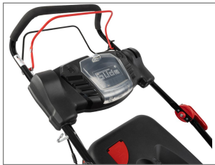
stabiles pulverbeschichtetes Stahlblechchassis