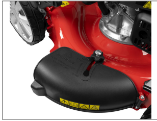
6-fach zentrale Schnitthöhenverstellung