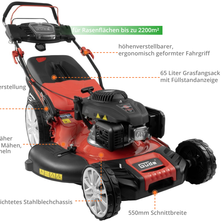
für Rasenflächen bis zu 2200m 2